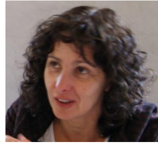
Fecha nacimiento: 12 diciembre del 1959 Bilbao (Vizcaya), 2 hijos